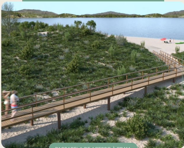
PASSARELA DE ACESSO À PRAIA

E por falar em valorização, você estará adquirindo um imóvel em uma das regiões com maior potencial de crescimento no litoral catarinense, fazendo deste projeto uma oportunidade única tanto para morar quanto para investir.