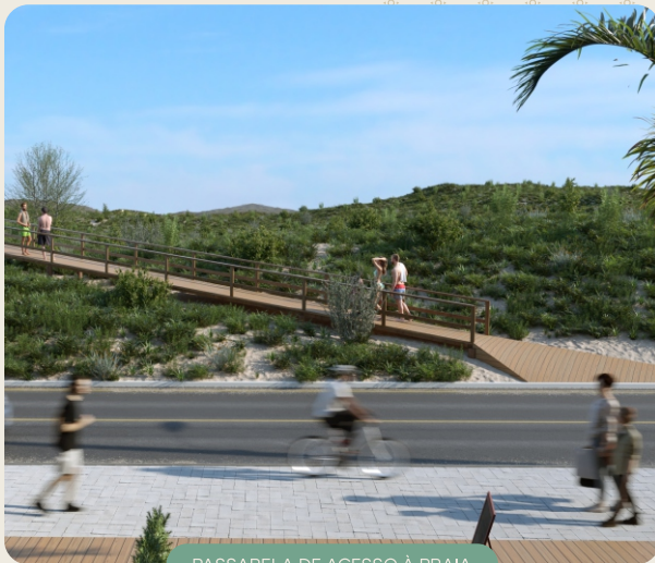
PASSARELA DE ACESSO À PRAIA