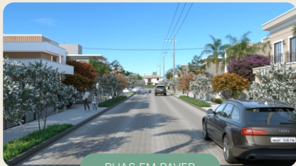
RUAS EM PAVER