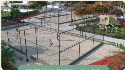
QUADRA DE AREIA E PET PLACE