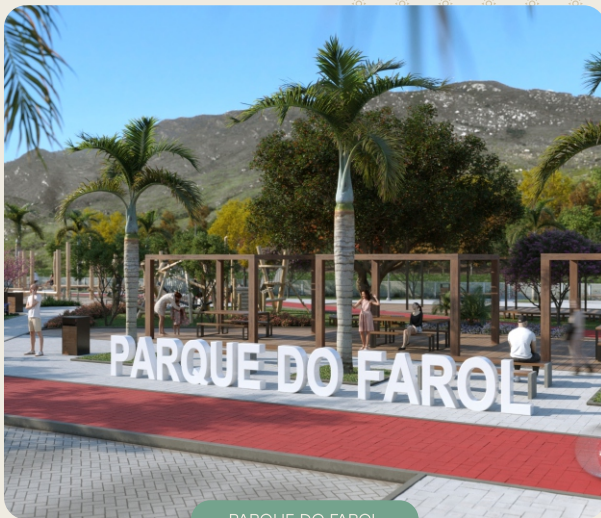
PARQUE DO FAROL