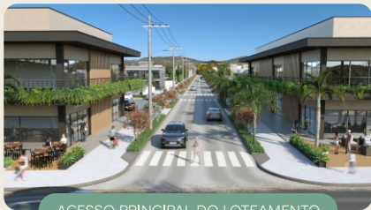
ACESSO PRINCIPAL DO LOTEAMENTO