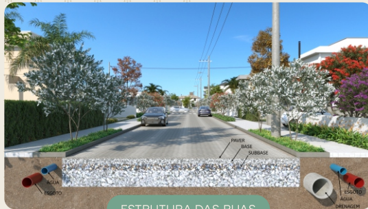
ESTRUTURA DAS RUAS

As ruas do loteamento são pavimentadas com paver, garantindo maior permeabilidade e durabilidade, em harmonia com as calçadas amplas e arborizadas.