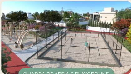
QUADRA DE AREIA E PLAYGROUND